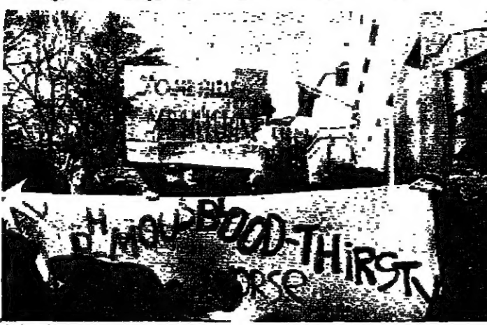
الآيات الشيطانية، الروائي البريطاني سلمان رشدي

اعلن الرئيس الفرنسي فرانسوا ميتران امس الاثنين في تعليقه على التوتر الذي نشأ بين ايران والشرق الغربية، بسبب قضية رشدي انه وبمواجهة التصب والموهبة التي ولدتها وضعا لا يطاق علينا من الطبيعي ان نتوقع كل شيء. وعندما سئل من خطر عودة العمليات الارهابية، بعد حكم الاعدام الذي اصدره الضميري على الكاتب البريطاني سلمان رشدي مؤلف كتاب «آيات شيطانية»، قال الرئيس الفرنسي في المؤتمر الصحافي الذي عقد في باريس امس الاثنين: كانت تتوقع ان الفرضيات الاخرى سوعا، من اجل ان جعلها عنيفة، فنتسخر لنرا اذا كانت ستعطي علينا ان نتوقع كل شيء. وهذا هو استعدادنا النفسي.